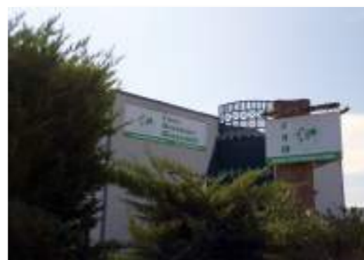
SIÈGE DU GROUPE FRM DANS LE SUD DE LA FRANCE À MONTPELLIER

Pour faire avancer la cause des forêts tropicales, nous privilégions avant tout la proximité terrain, la rigueur scientifique, le pragmatisme, la formation et le dialogue.